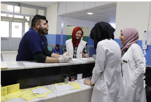
الفريق الطبي في مستشفى الامام علي.

جهاز Genexpert تم التبرع فيه إلى العيادة الصدرية والتنفسية في الرصافة