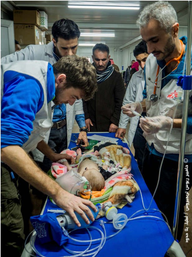
طفل رضيع يتلقى العلاج لالتهاباته الصدرية في غرفة الطوارئ بمستشفى القيارة.

1 غرفة طوارئ تم إعادة تأهيلها بشكل كامل مع نظام للفرز الطبي وصيدلية وغرفتي استشارات