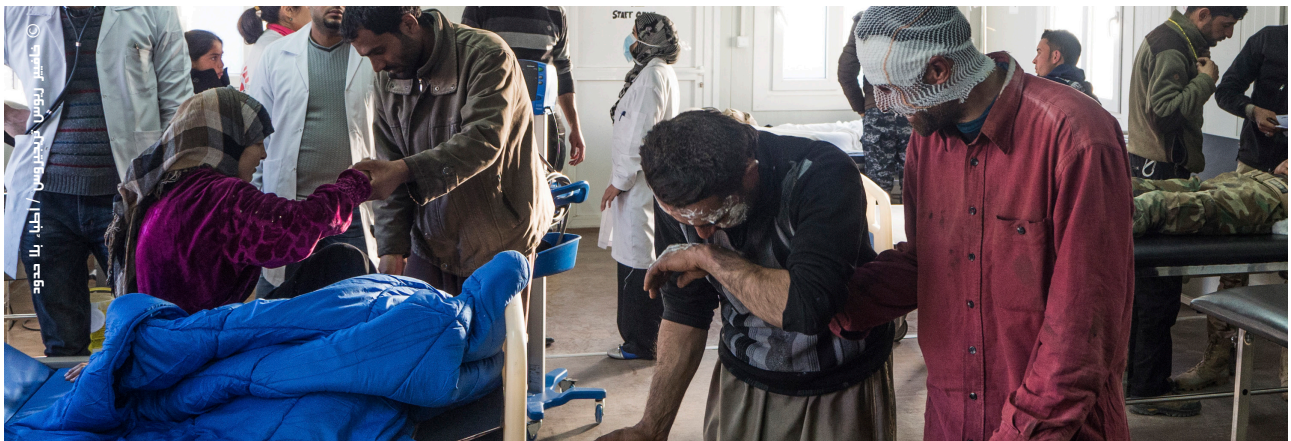
غرفة الطوارئ في مستشفى القيّارة