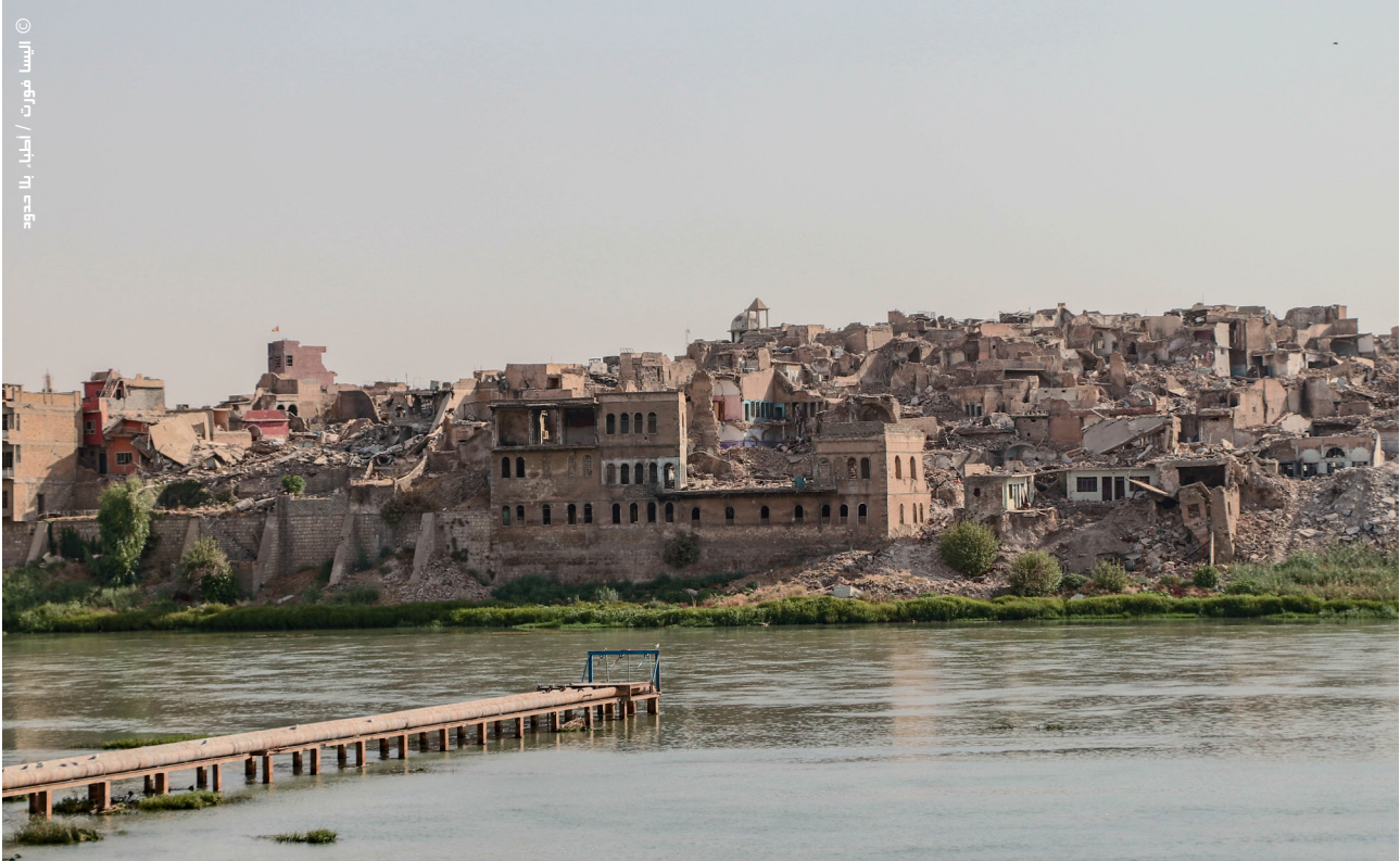
مشهد لغرب الموصل من الضفة الشرقية لنهر دجلة.